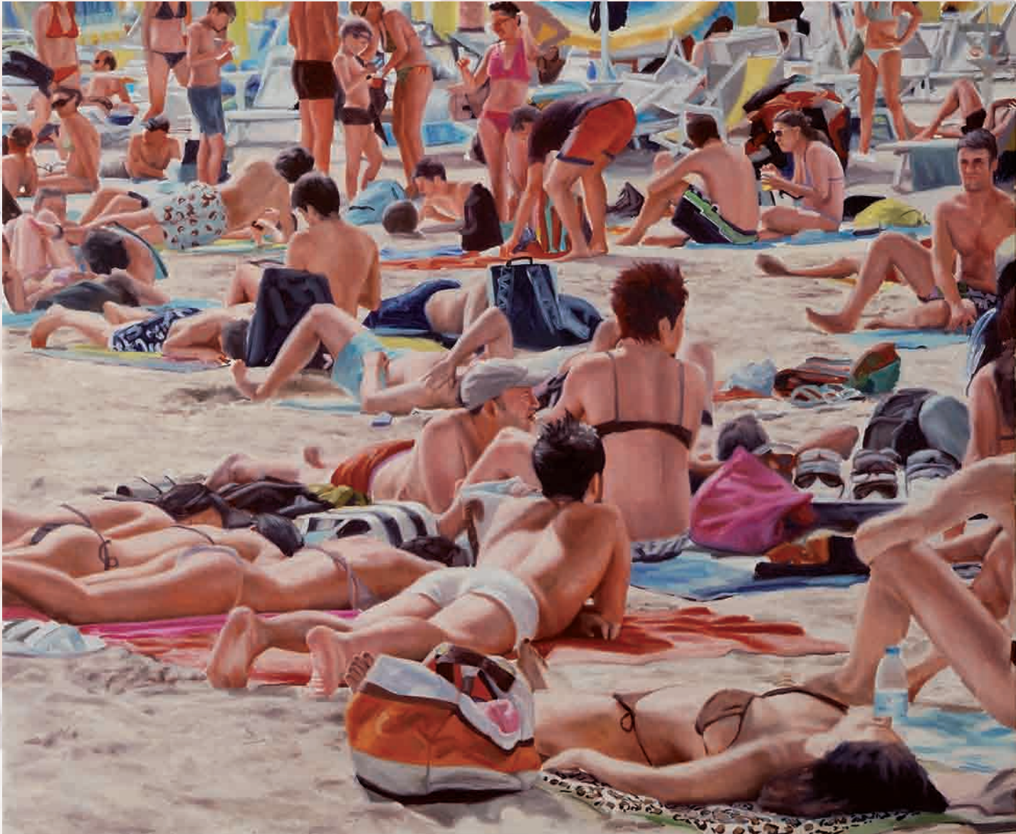
Meet Someone, Huile sur Toile, 100 x 120 cm