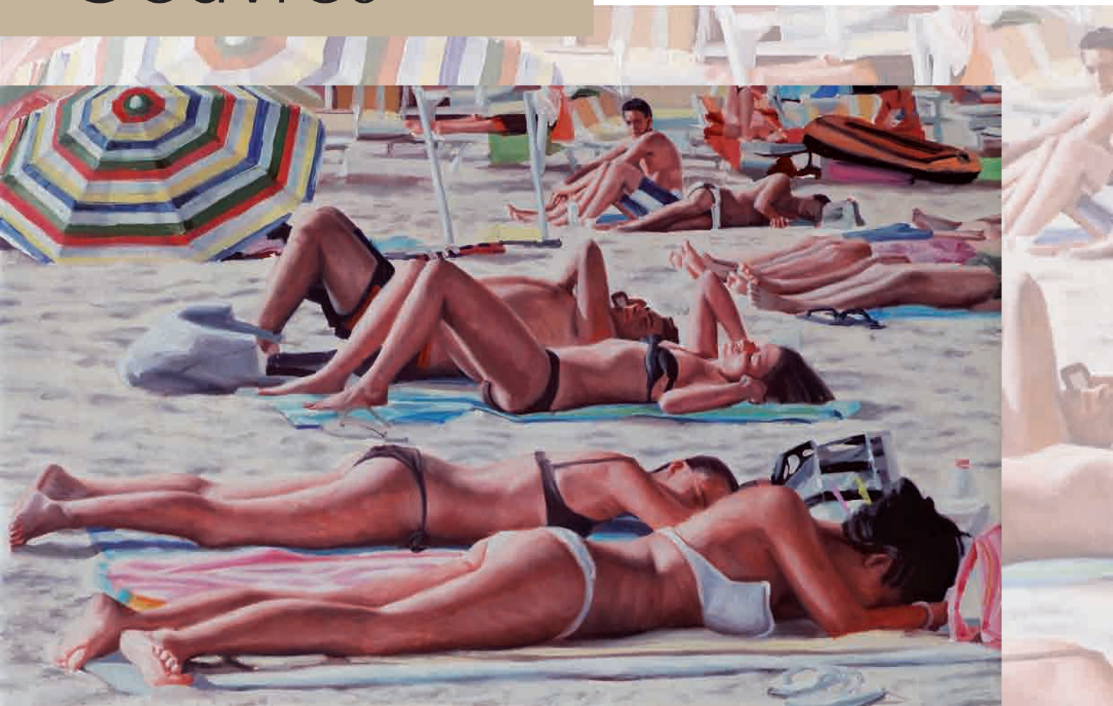
Distesi al Sole - Big Umbrella, Huile sur Toile, 50 x 80 cm