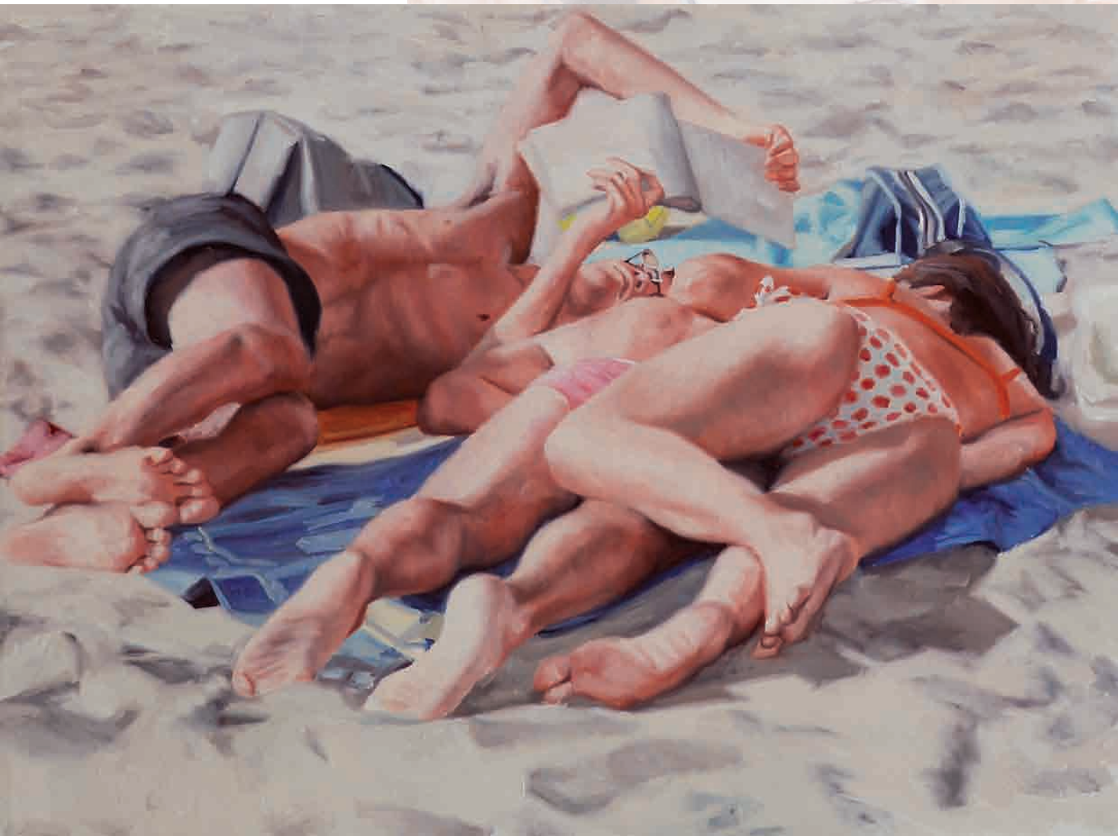
Distesi al Sole - Crossword Puzzle, Huile sur Toile, 60 x 80 cm