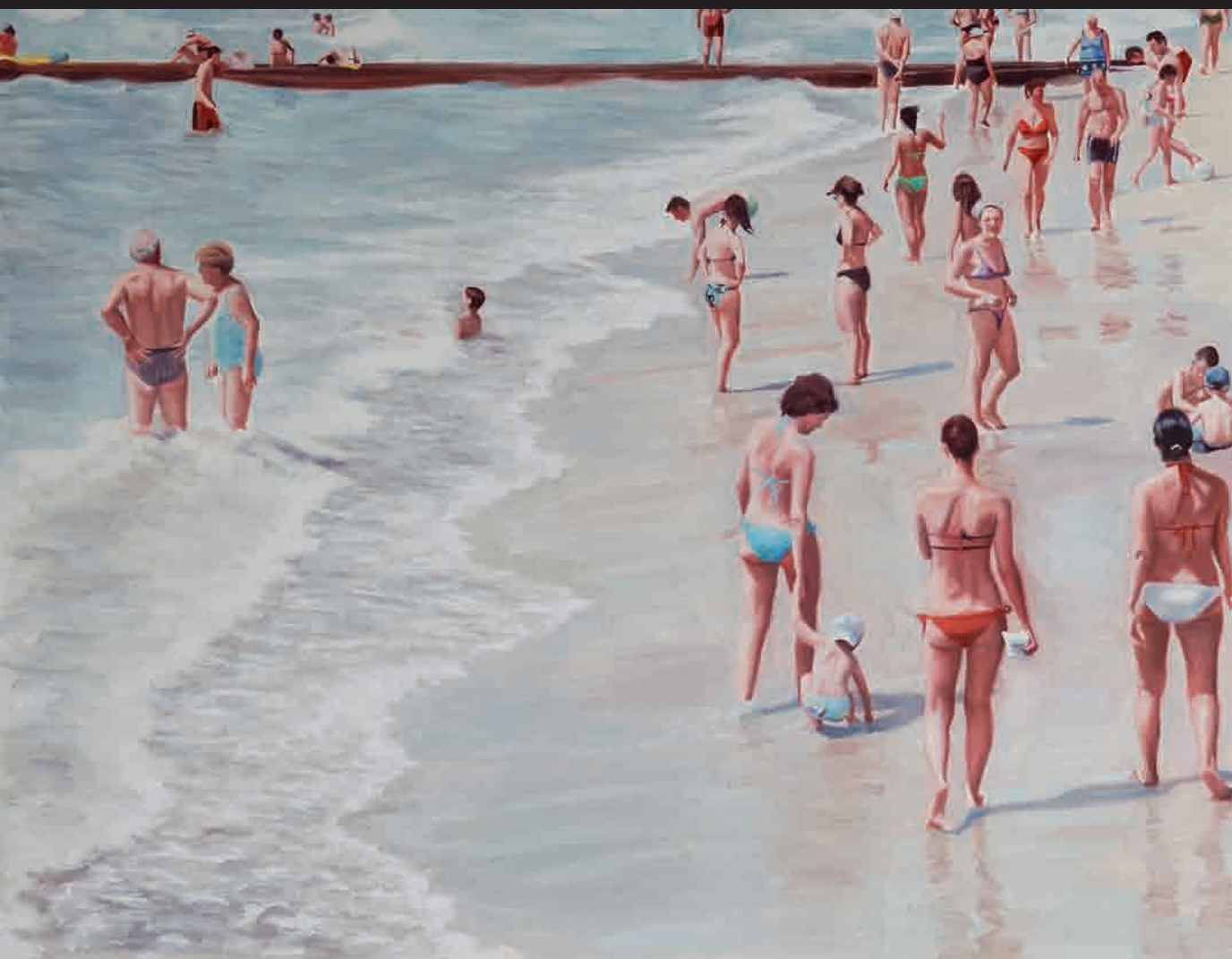
Shoreline, Huile sur Toile 100 x 130 cm