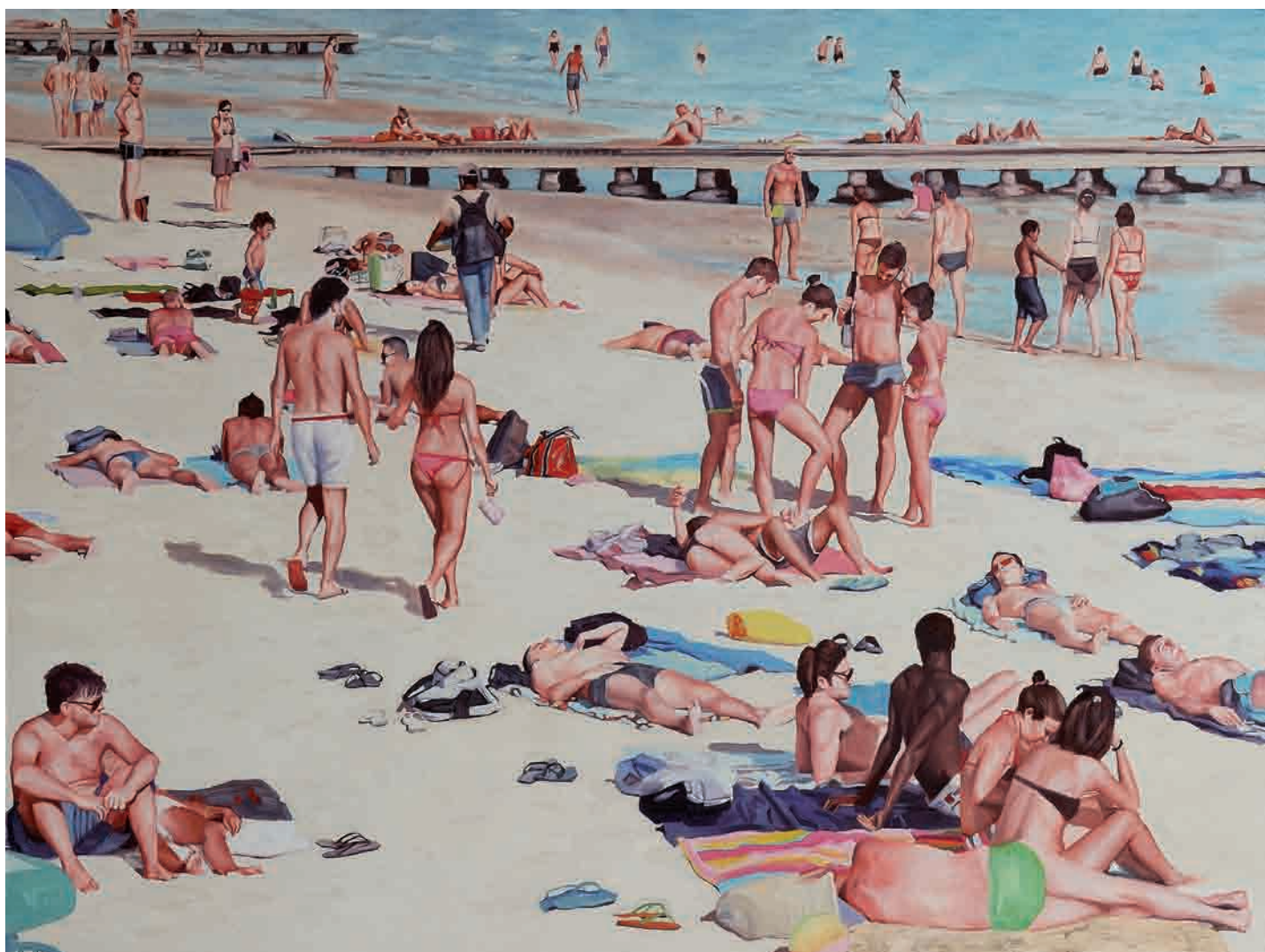
Near the Jetty, Huile sur Toile 150 x 200 cm

Vernissage le Jeudi 24 Mai 2012 de 18h à 21h